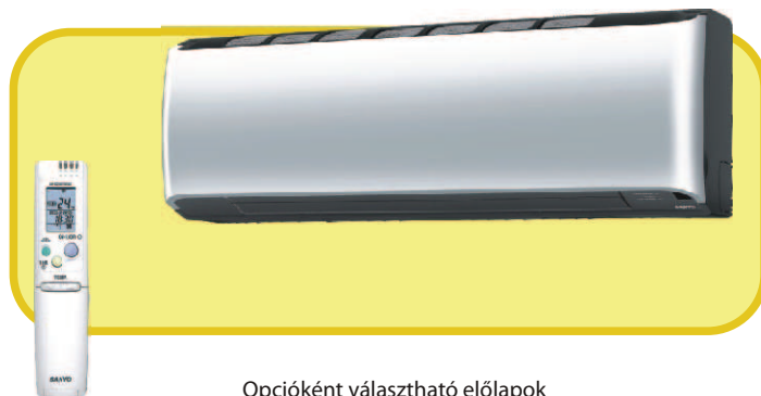
Opcióként választható előlapok